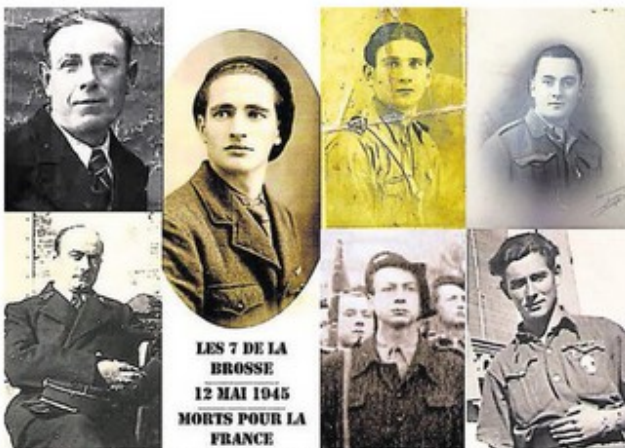
LES 7 DE LA BROSSE 12 MAI 1945 MORTS POUR LA FRANCE

Dimanche 2 octobre , à la Brosse. 8 h 45, signature de la Charte des