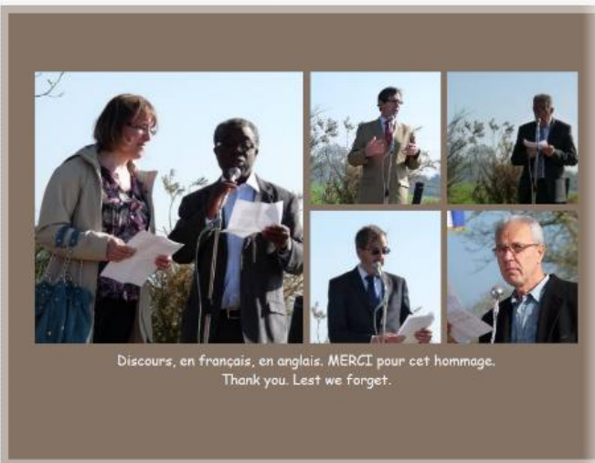
Discours, en français, en anglais, MERCI pour cet hommage. Thank you. Lest we forget.