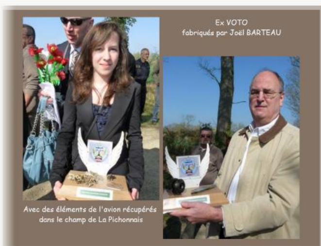
Ex VOTO fabriqués par Joel BARTEAU