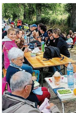
Troisième étape de la sortie « Devoir de mémoire ».