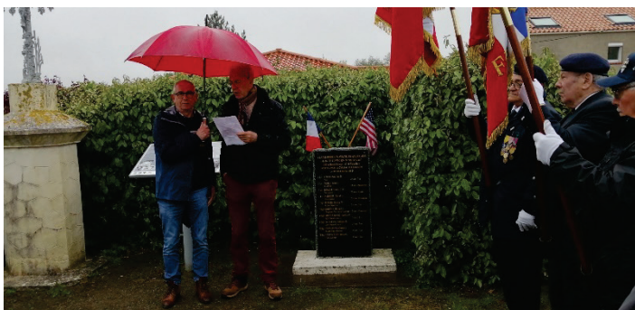
Hommage aux aviateurs du B17 américain Le 4 mai 2024 en présence de 22 personnes