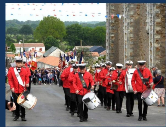
Défilé vers le mémorial de la Poche sud à La Sicaudais le 7 mai 2022

Du naufrage du Lancastria, coup de gong tragique de la guerre dans notre région le 17 juin 1940, jusqu'à l'explosion de la Brosse le 11 mai 1945, en passant par les crashes d'avions alliés, la catastrophe du Boivre, les actes de résistance et la déportation, ce chemin de la mémoire révèle un tableau complexe de l'occupation et des souffrances liées à la guerre jusqu'à sa dernière page historique, celle de la poche de Saint-Nazaire.